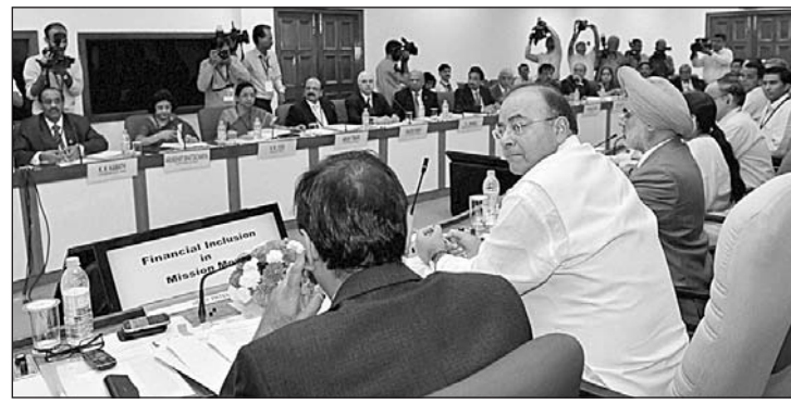
बँकप्रमुख आणि वित्तीय संस्थांच्या सीईओ यांना मार्गदर्शन करताना अर्थमंत्री अरुण जेटली.

नवी दिल्ली, दि. ३१ (वृत्तसंस्था) - सरकार नवा आर्थिक कार्यक्रम ‘मिशन’ म्हणून राबविणार असून त्यातच प्रत्येक घट्टी बचत, पतपुरवठा, पैसे काढणे, विमा आणि पेन्शन आदी सुविधांची तरतूद असणार आहे, असे केंद्रीय अर्थमंत्री अरुण जेटली यांनी म्हटले आहे.